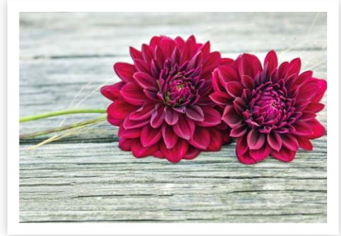
Trauerkarte mit Dahlien

Seit Anfang 2023 ist das neue Erbrecht in Kraft. Es gibt Erblasser:innen mehr Spielraum bei der Gestaltung ihres Testaments. Auch am Lebensende können wir weiterhin die Welt schöner machen.