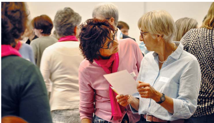
Die Bingo-Fragen sorgten für Austausch und gute Laune.

Gemäss Statuten haben Kantonalverbände, Ortsvereine und Mitgliederverbände je nach Grösse eine bestimmte Anzahl Delegiertenstimmen. Zu den Delegierten zählen auch Einzelmitglieder. Gesamthaft sind es 240 Delegierte, die sich neu auf drei Jahre in diese Funktion wählen lassen. Mit einem Delegierten-Bingo kamen die Frauen ins Gespräch und Bewegung in den grossen Saal im Titthof Chur.