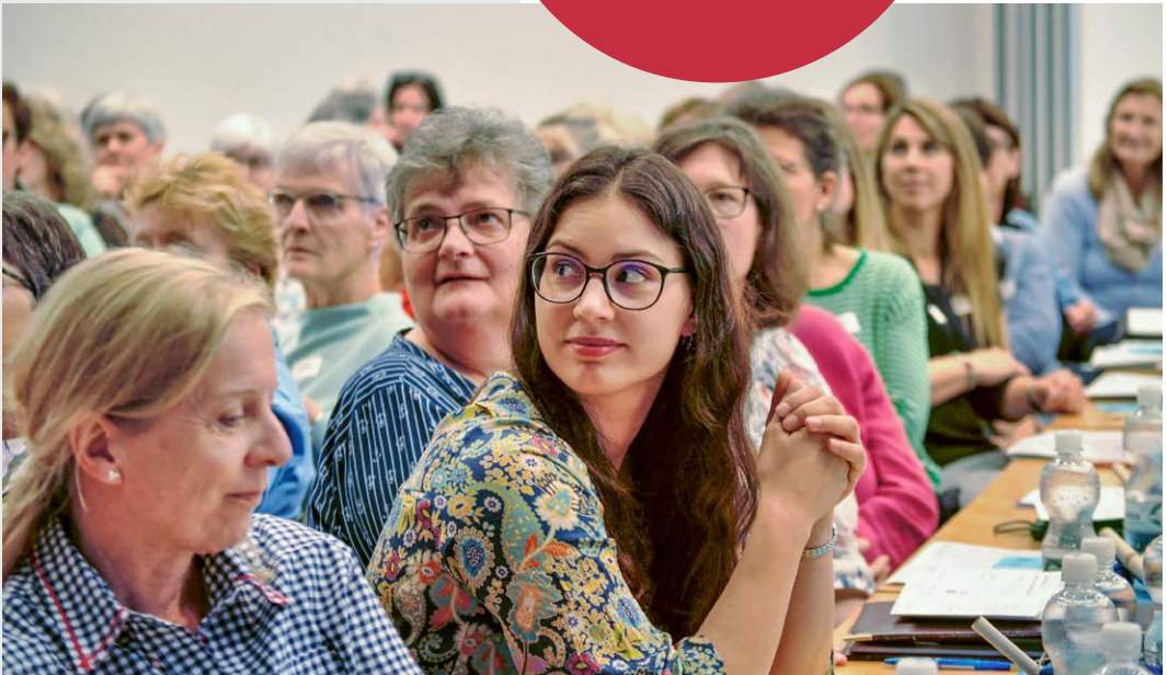
Der Frauenbund blickte an der Delegiertenversammlung in die Zukunft